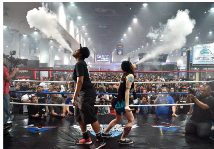
Рис. 2. Вейпинг соревнование

Быстрому распространению курения ЭС (вейпингу) способствуют компании-производители, которые превратили курение ЭС в целую субкультуру. В мире на регулярной основе проводятся субсидируемые компаниями-производителями выставки и соревнования среди курильщиков ЭС (рис.2). Это так называемые: «Cloudchasing» (мастерство выдувания облаков пара), «Tricks» (трюки с паром) и «Вейпинг-алхимия» (соревнования по составлению новых жидкостей для вейпа).