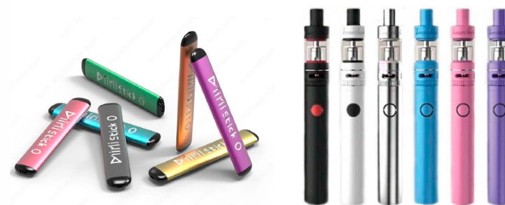
Рис. 5. Одноразовые (слева) и многоразовые (справа) электронные сигареты

Одноразовые ЭС рассчитаны на 200 - 500 затяжек пара. В многоразовых устройствах нет таких ограничений и они работают до тех пор, пока доливается жидкость в емкость.