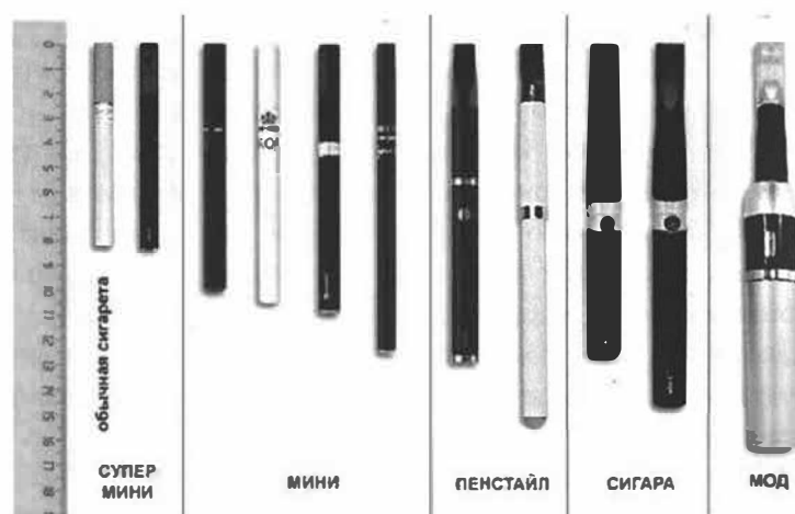
Рис.4. Типы и размеры электронных сигарет

Электронные сигареты (вейпы) классифицируются также по типу и размеру (рис.4) в соответствии с длиной (от 82 мм до 175 мм).