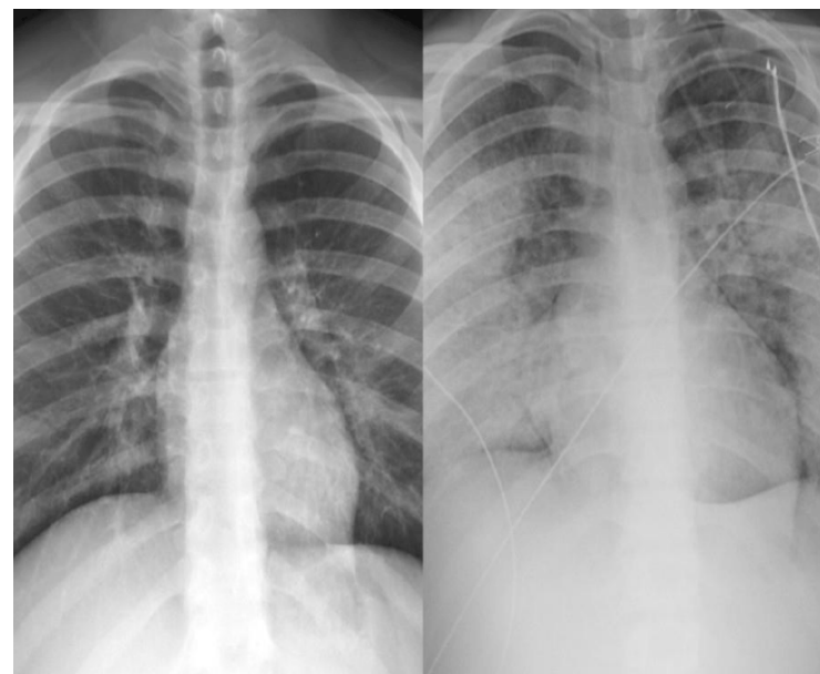
Рис.6. Здоровые легкие (слева) и легкие после 5 дней использования вейп-устройства

как: «Повреждение легких, связанное с употреблением электронных сигарет или продуктов вейпинга». Данное заболевание будет внесено в МКБ-11, а пока CDC рекомендует кодировать эту болезнь другими подобными заболеваниями. EVALI может отражать спектр болезненных процессов, а не один конкретный процесс. Отдельные сообщения о заболеваниях легких, связанных с вейпингом, описывают острую эозинофильную пневмонию, диффузное альвеолярное кровоизлияние, липоидную пневмонию, и респираторный бронхиолит, ассоциированный с интерстициальным заболеванием легких (рис.6).