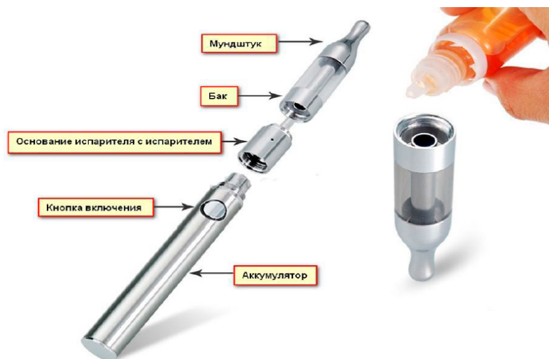
Рис. 3. Устройство электронной сигареты

Обычная электронная сигарета состоит из аккумулятора, электрического испарителя, емкости для жидкости, мундштука и дополнительных элементов для автоматического управления подачей ароматической жидкости (но последние имеются не во всех моделях), рис.3.